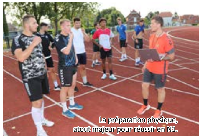
La préparation physique, atout majeur pour réussir en N1.