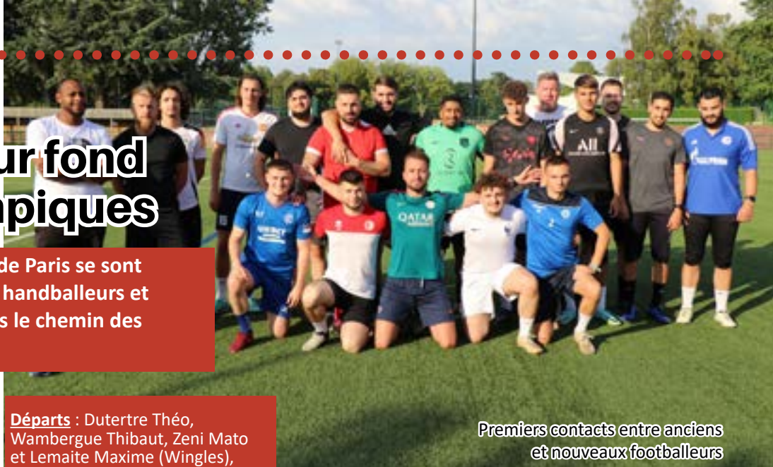
Premiers contacts entre anciens et nouveaux footballeurs