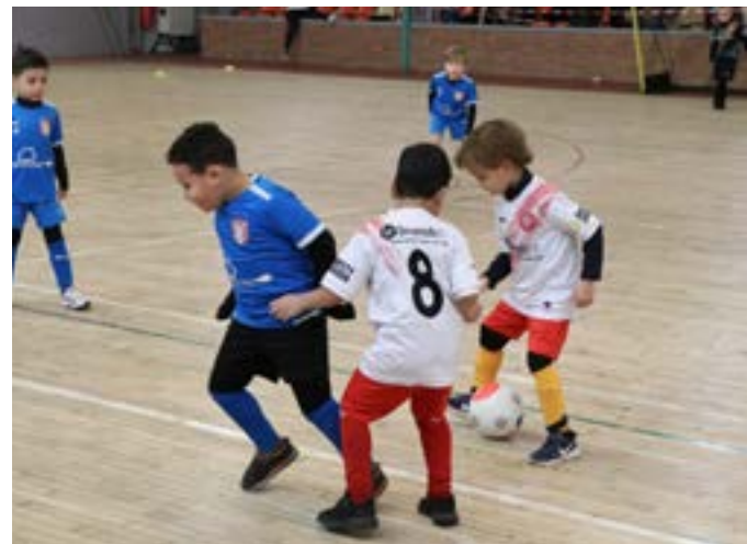
Les U6/U7 de Billy en action

Félicitations à tous les bénévoles qui ont œuvré pour que cette manifestation soit une réussite.