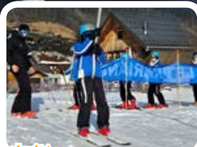
Scolarité La classe à la montagne