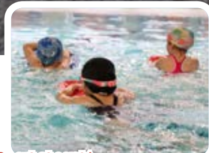
Sport et santé Lutter contre l'aquaphobie