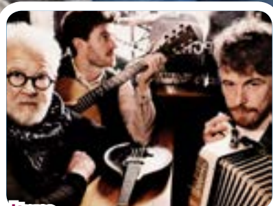
Culture Demandez le programme !